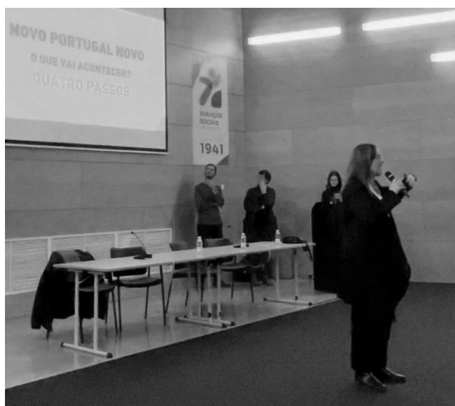
Imagem - Sessão aberta e participada com CML e moradores, para propor metodologia de trabalho para o Novo Portugal Novo, dezembro 2024.