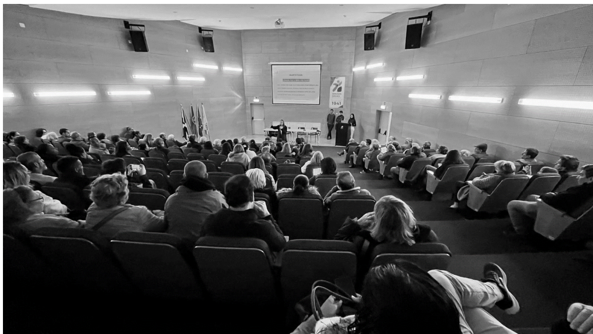
Imagem 01 - Sessão aberta e participada com CML e moradores, para propor metodologia de trabalho para o Novo Portugal Novo, dezembro 2024.

Pretende-se uma ideia de imagem urbana e planeamento, norteados por uma transformação ponderada deste artefacto histórico e pela eficácia na promoção de habitação digna para os moradores – uma ideia para o Novo Portugal Novo.