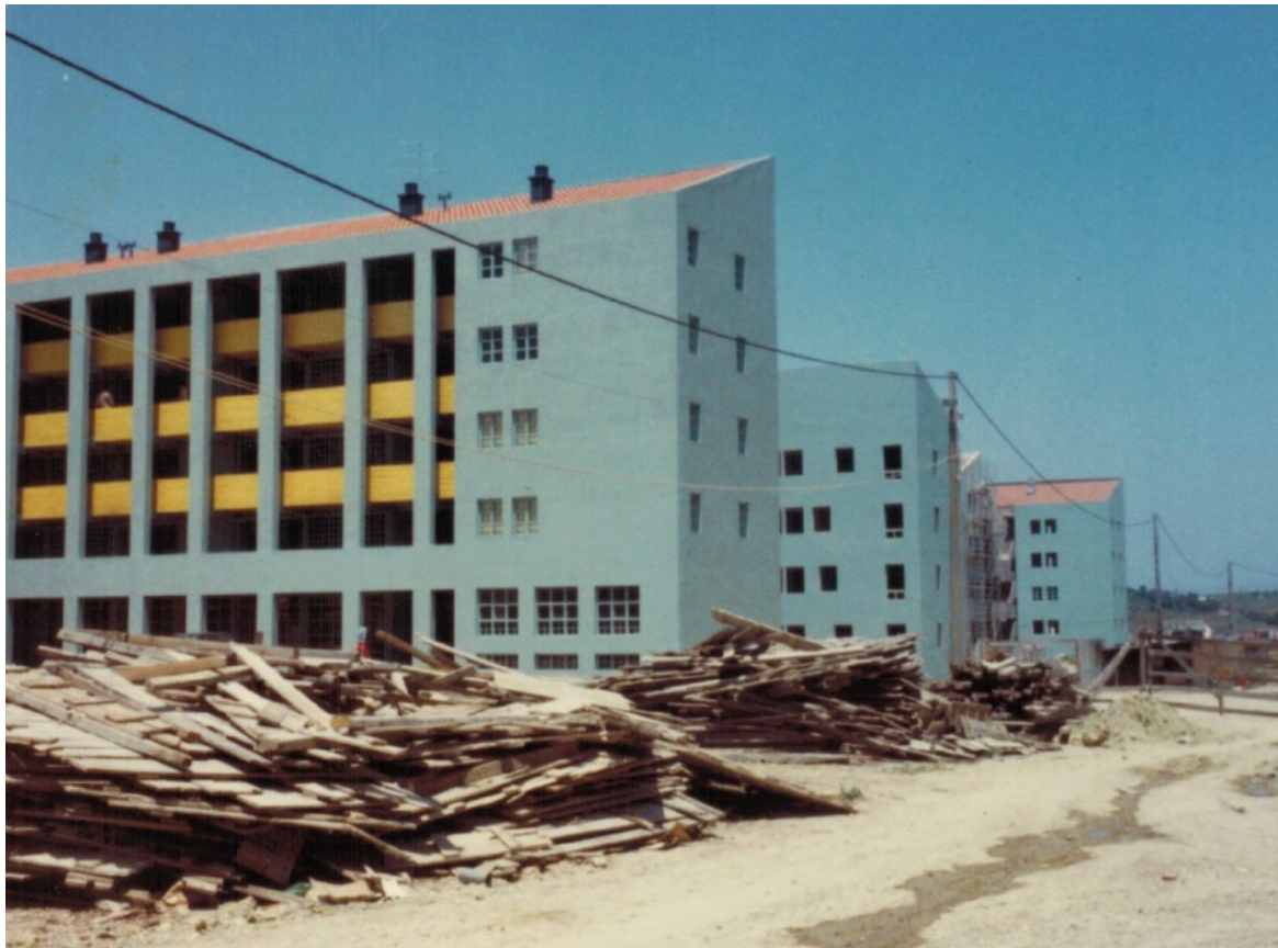
Imagem 07 – Portugal Novo em construção, 1981-84. Fundo Manuel Vicente. CDUA/FAUP