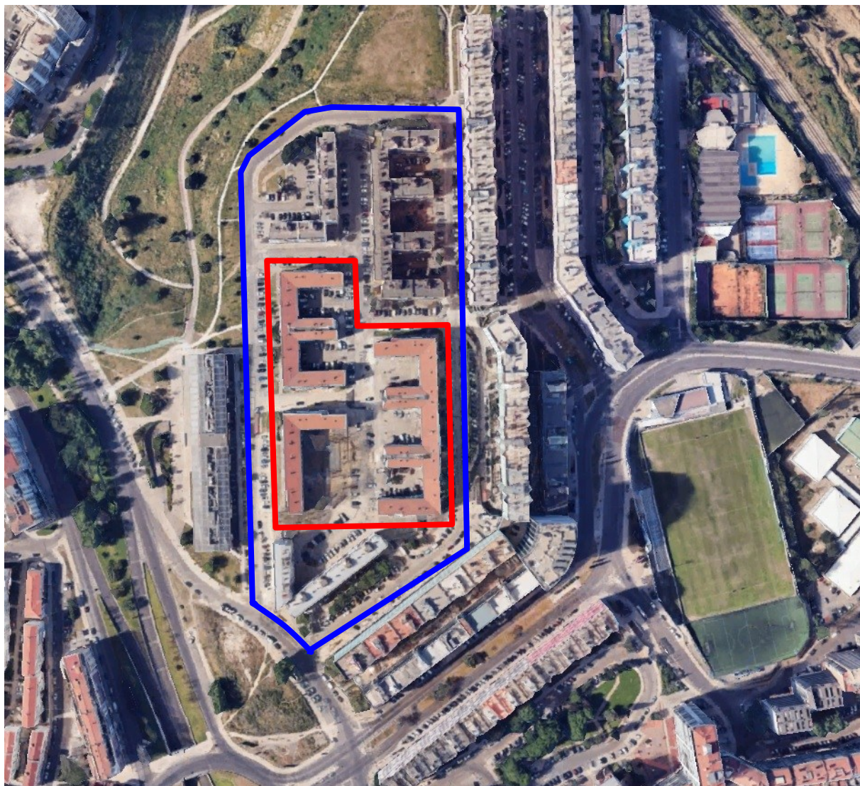
Imagem 04 – Área de intervenção, considerando polígono externo (azul) para arranjos exteriores e possível implantação de edifício-volante e polígono interno (encarnado) identificando os edifícios existentes alvo de intervenção.

A Área de Intervenção (ver Imagem 04) é delimitada por dois polígonos, associados a dois níveis de intervenção: um polígono externo (indicado a cor azul na imagem 04) para arranjos exteriores e possível implantação de edifício-volante para viabilizar um primeiro realojamento que liberte frente de obra nos edifícios existentes e polígono interno (indicado a cor encarnada na imagem 04) identificando os edifícios existentes alvo de intervenção.