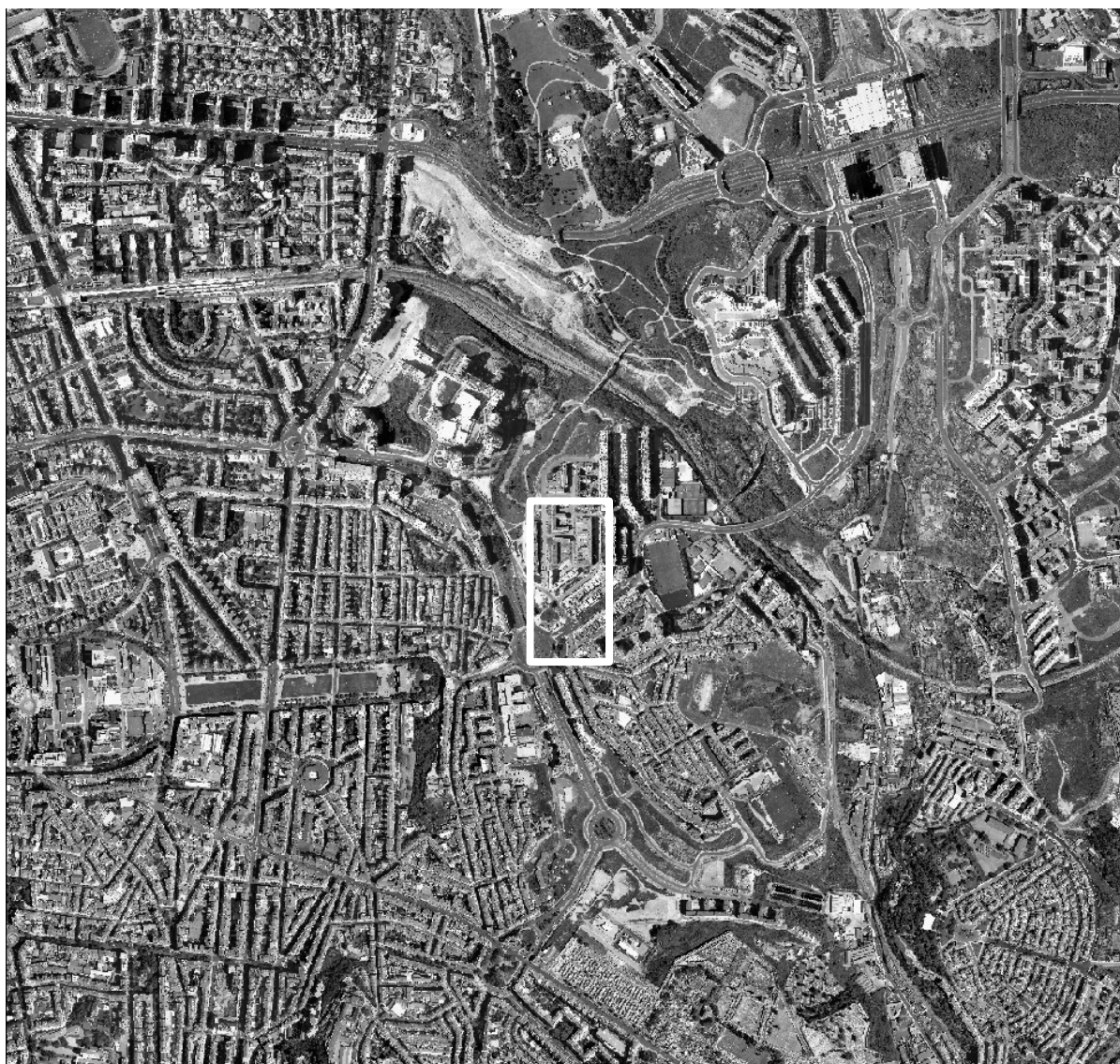
Imagem 03 – Localização do conjunto Edificado do Bairro Portugal Novo.